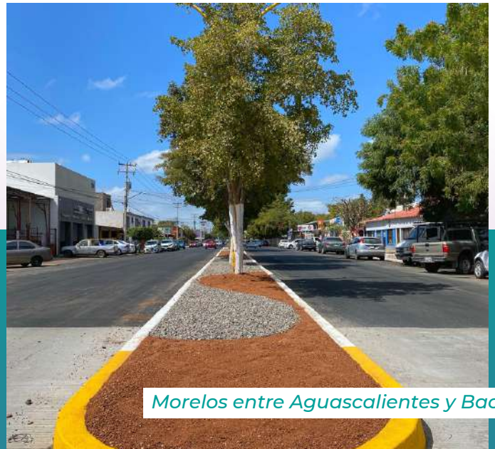
Morelos entre Aguascalientes y Bacatete