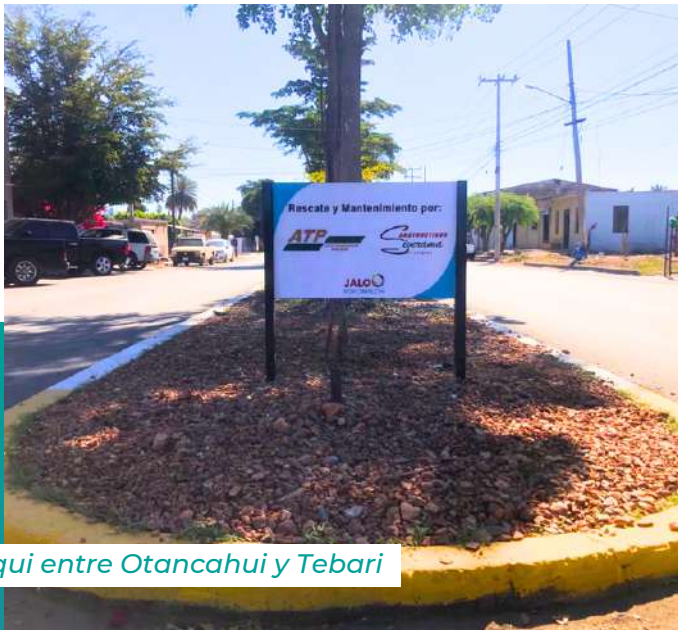
Yaqui entre Otanchahui y Tebari