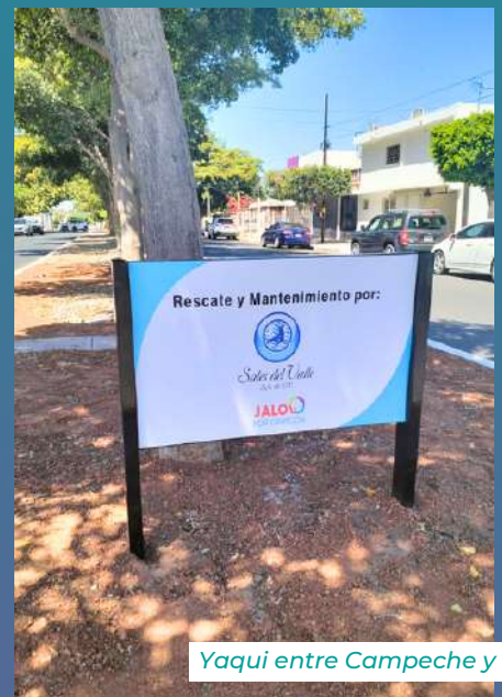
Yaqui entre Campeche y Yucatán